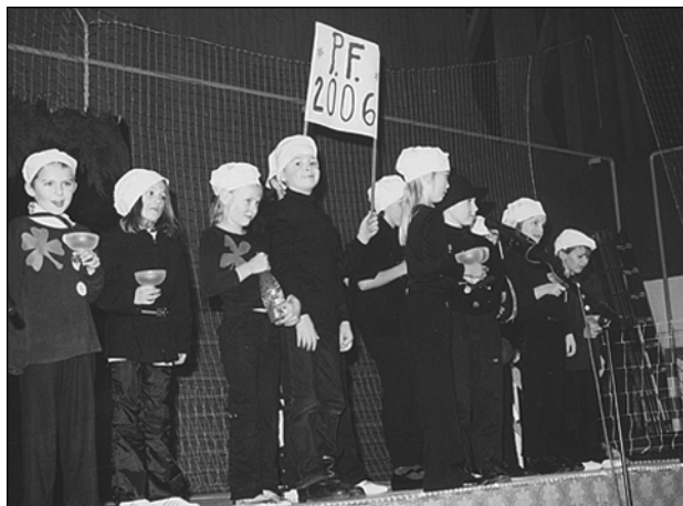
Všichni podali maximální výkony.