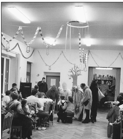
Přišel Mikuláš, čert i anděl.