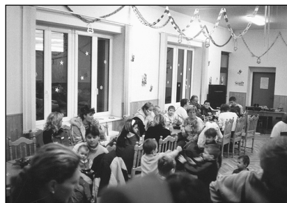
Mikulášská nadílka v Hroneticích.