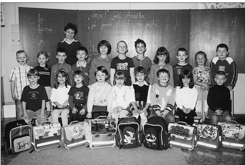
Prvníčkové ve školním roce 2005/6